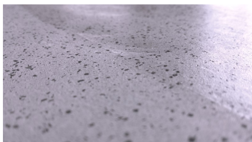
Links unten: ungeschützt