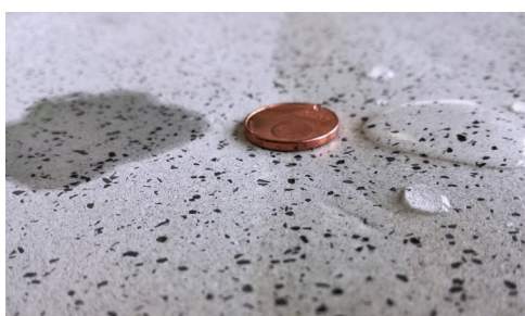
Links: ungeschützt - Wasser dringt ein