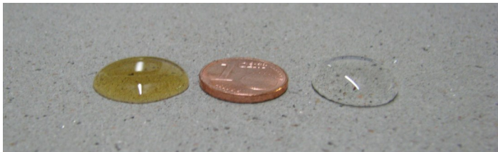
Links: geschützt mit COLORTEC® Max , links Öl, rechts Wasser

Die Lebensdauer der COLORTEC® MAX -Imprägnierung ist abhängig von einer Vielzahl von Faktoren (Betonrezeptur und -oberfläche, Expositionsbedingungen, meteorologische Parameter, Applikation, Nutzung, Reinigungsart und -häufigkeit ...) und liegt im Normalfall zwischen 2 und 10 Jahren. Sollte ein Nachlassen der Schutzwirkung festgestellt werden, empfehlen wir die Reinigung und anschließende Nachbeschichtung mit COLORTEC® MAX .