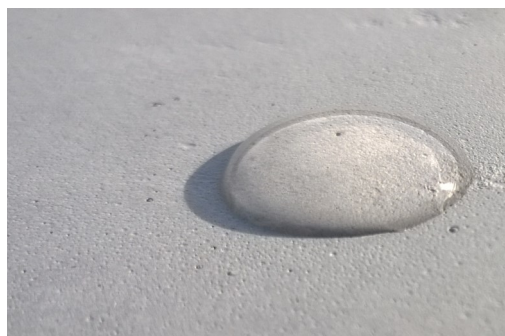
Sichtbeton mit COLORTEC® finish

Der zu behandelnde Untergrund sollte trocken, saugfähig, sauber, frostfrei und tragfähig sein. Das Produkt COLORTEC® finish „CTR“ kann, nach entsprechenden Vorversuchen, bereits mehrere Tage nach der Entschalung des Betonbauteils angewendet werden. Aufgrund der bestehenden und ständig fortschreitenden Vielfalt der verwendeten Betone bzw. deren Herstellungsverfahren, Inhaltsstoffen, Trennmitteln... ist der ideale Applikationszeitpunkt im Vorversuch zu bestimmen, insbesondere um auszuschließen, dass eventuelle, noch auf der Betonhaut vorhandene Rückstände von Trennmitteln/Schalölen oder Nachbehandlungsmitteln das Eindringverhalten von COLORTEC® finish „CTR“ beeinträchtigen und zu Verfärbungen führen. Dies ist üblicherweise bei Betonoberflächen, welche Ihre Endfestigkeit erreicht haben, weniger relevant.